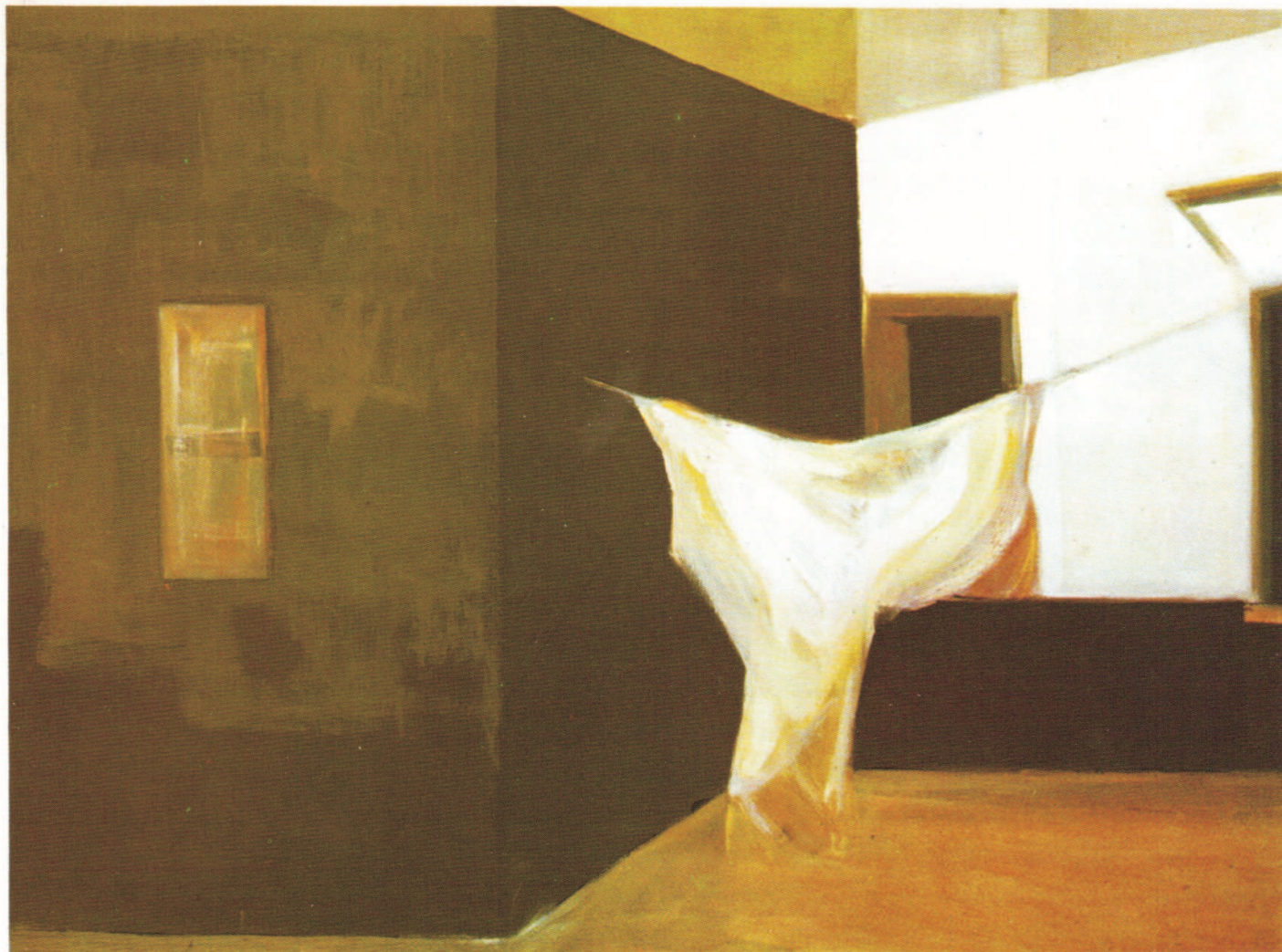
Oleo 1'30 x 0'97 «Terraza».